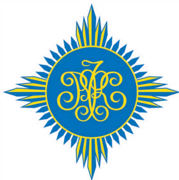
РОССИЙСКИЙ ФОНД КУЛЬТУРЫ

Корпоративная идентичность — одно из самых сильных визуальных средств воздействия на людей. Данное руководство призвано обеспечить сохранение стандартов корпоративной идентичности, отражающей статус и идеологию Российского фонда культуры, приверженность Фонда принципам «Просвещённого консерватизма».